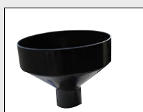
Entonnoir de remplissage