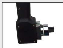
Commutateur de projection (cuve ou mélange)