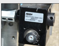
Vanne de mélange micrométrique