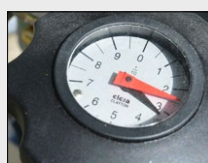
Cadran de réglage