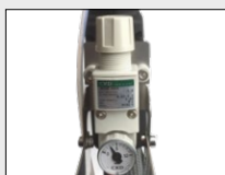
Régulateur de pression à distance