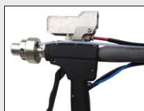
Pistolet H 2 O + commandes à distance + Tuyau